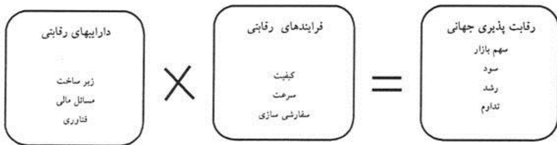
شکل ۱- فرمول رقابت پذیری جهانی [۲]

بر همکنش چهار عامل اصلی می‌داند: 1- فاکتورهای درونی؛ 2- شرایط تقاضای داخلی؛ 3- صنایع مرتبط و حمایت کننده؛ 4 - استراتژی، ساختار و رقابت. به اعتقاد «پورتر»، این فاکتورهای چهارگانه به صورت متقابل بر یکدیگر تاثیر دارند و تغییرات در هر کدام از آنها می‌تواند بر شرایط بقیه فاکتورها مؤثر باشد [5]. علاوه بر آن، دو عامل بیرونی دولت و اتفاقات پیش‌بینی نشده نیز بر عوامل چهارگانه تأثیر غیر مستقیم دارند و از طریق تأثیر بر آنها می‌توانند در رقابت‌پذیری نیز تأثیر گذار باشند. الف - فاکتورهای درونی: مجموعه‌ای از عوامل مؤثر در تولید کالا یا خدمات، مانند مواد اولیه، کیفیت و میزان دسترسی به آن، نیروی انسانی بدون مهارت و یا ماهر